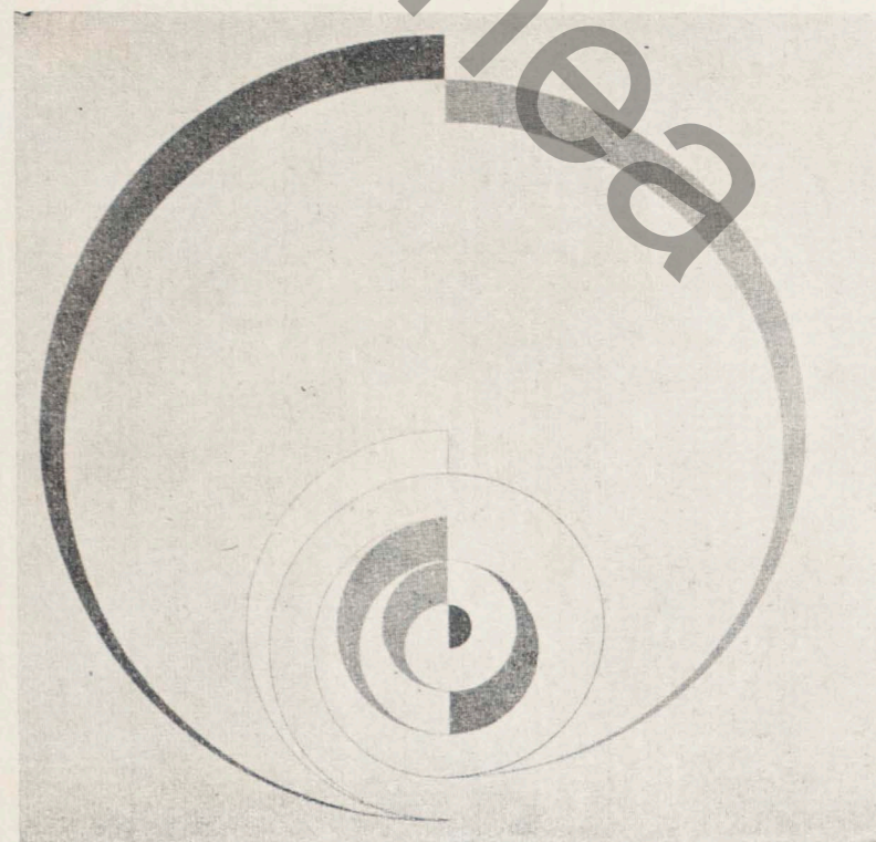
Ivan Serpa — "Pintura n.º 95" (Grupo Frente)