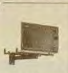
Suporte para Forno 3 X R$ 5,60

FAX: 298-6880 METRO SANTANA R. Gabriel Piza, 216