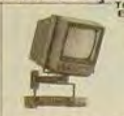
Suporte p/TV e Video 3 X R$ 7,80

O MELHOR PREÇO À VISTA. LIGUE JÁ TELEVENDAS 959-5263 959-4751 299-3045