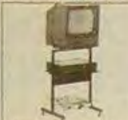
Mesa p/TV e Video 3 X R$ 9,90

TODA LINHA DE SUPORTES TIPO EXPORTAÇÃO NA COR BRANCA