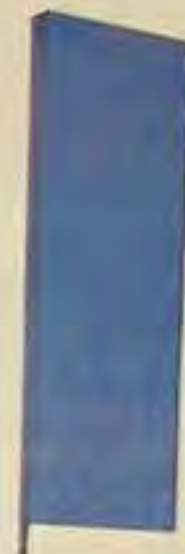
"Objeto-Ativo", 1960, do paulistano Willys de Castro (1926/1988)