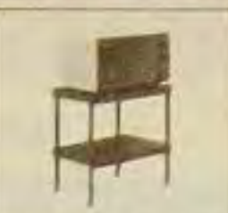
Mesa p/Forno-Lava louça 3 X R$ 13,50

* VENTILADORES DE TETO TATUAPÉ: R. Cel. Mendonça, 354 PINHEIROS: R. Antonio Boudo, 36 BROOKLIN: R. Texas 857-A