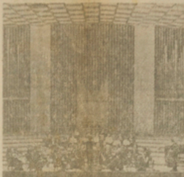
Collegium Musicum de la Universidad de Bonn.

* Participación de la Orquesta Collegium Musicum de Bonn