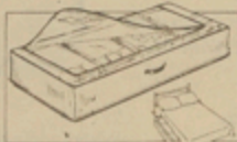
Guardaobjetos Bs. 49