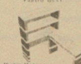
Muebles Mod. a la Par Bs.