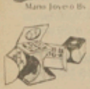
Caja de Belleza Bs. 15