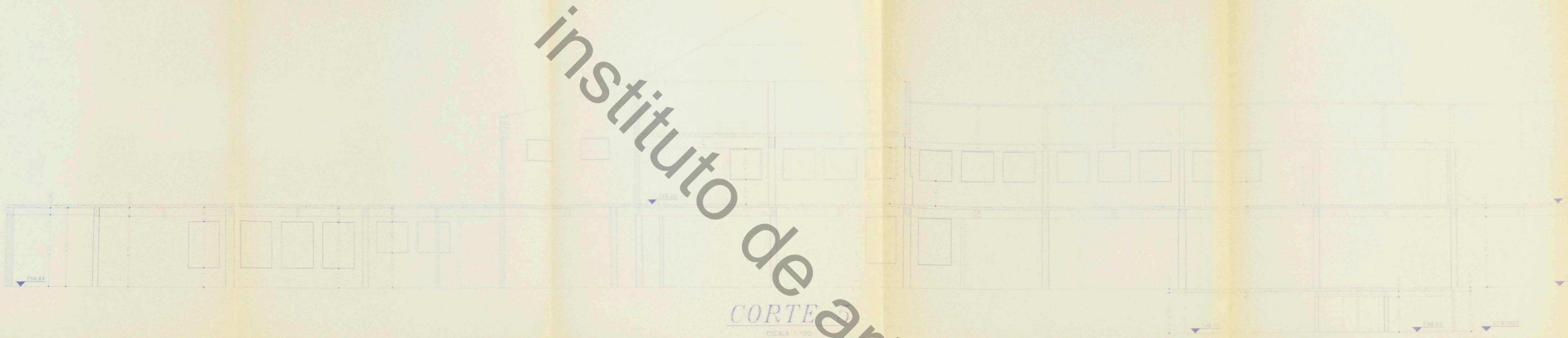
CORTE 5 ESCALA 1:100