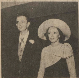
Os pais da noiva