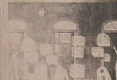
PRIMITIVO — Manezinho Araújo e um de seus quadros em exposição a partir de amanhã no Bonfiglioli — rua Augusta 2995.