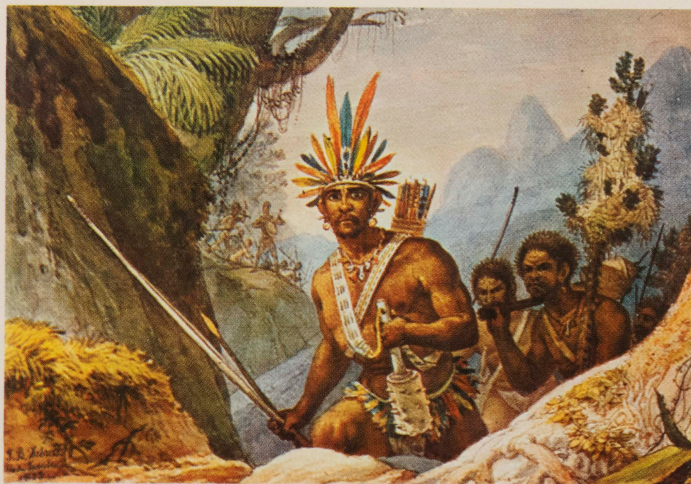
63 — DEBRET, Jean-Baptiste — Chefe Bororó — 14,5 x 21,4