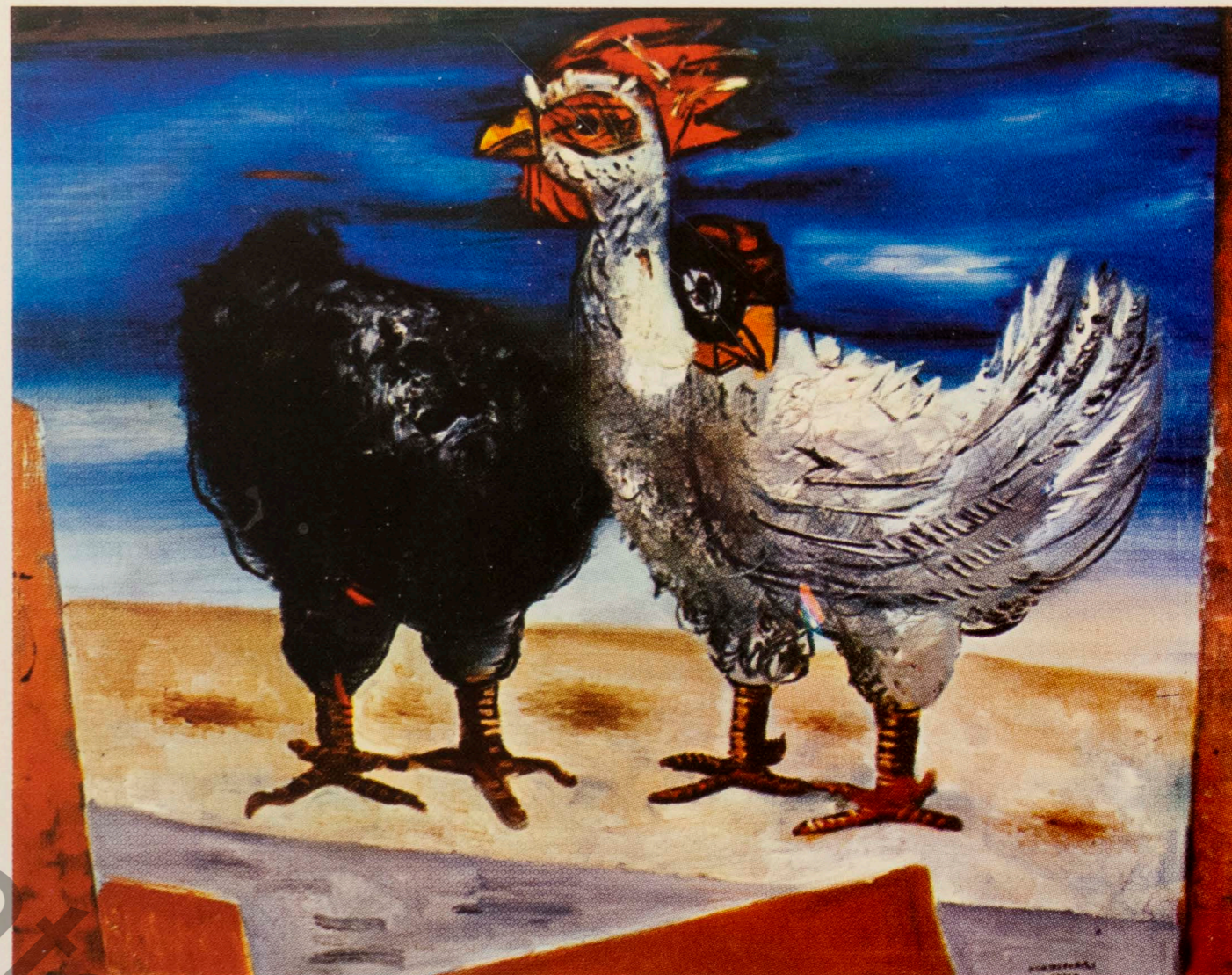
53 — PORTINARI, Cândido — Galo branco — 80 x 100