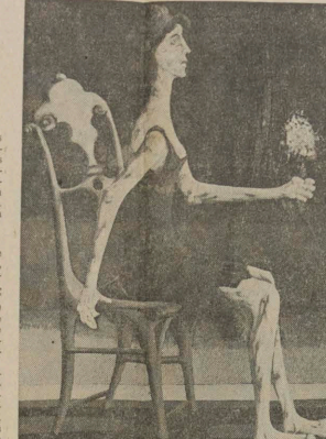
Os óleos de Graciano estão na Cosme Velho