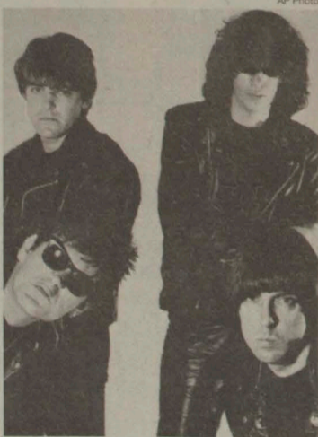
Ramones: Joey (de pé à direita)

Foi em 1974, em Nova York, que Joey (na época, tocando bateria), Johnny na guitarra e Dee Dee no baixo e vocal cria-