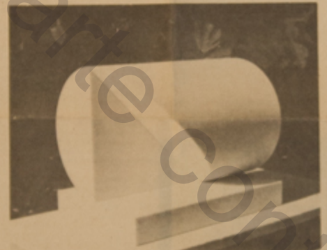
Obras de Sergio Camargo

cerro, que responde a su trayectoria como uno de los grandes artistas colombianos. La escultura, titulada "Torre" es un aluminio y está pintada de rojo cereza.