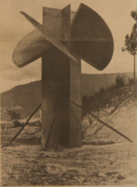
La "Torre" de Edgar Negret

Edgar Negret fue el asesor artístico de todo el programa del Parque de Esculturas, que reunió a 10 artistas latinoamericanos. Igual que ellos, el escultor-paysano dejó su obra en el