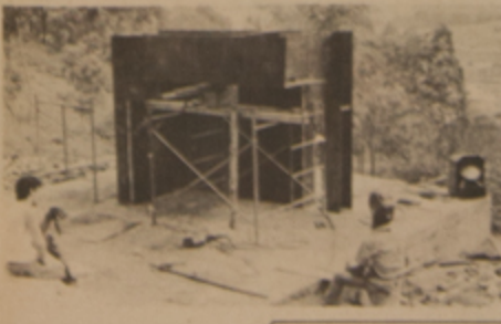
De Ronny Vayda

de marco para la gran ciudad que se aprecia al fondo. El creador de la obra nació en Facativán, Bogotá y su trabajo ha trascendido sobradamente nuestras fronteras, para pasearse por exigentes escenarios internacionales, donde Rojas ha representado a Colombia