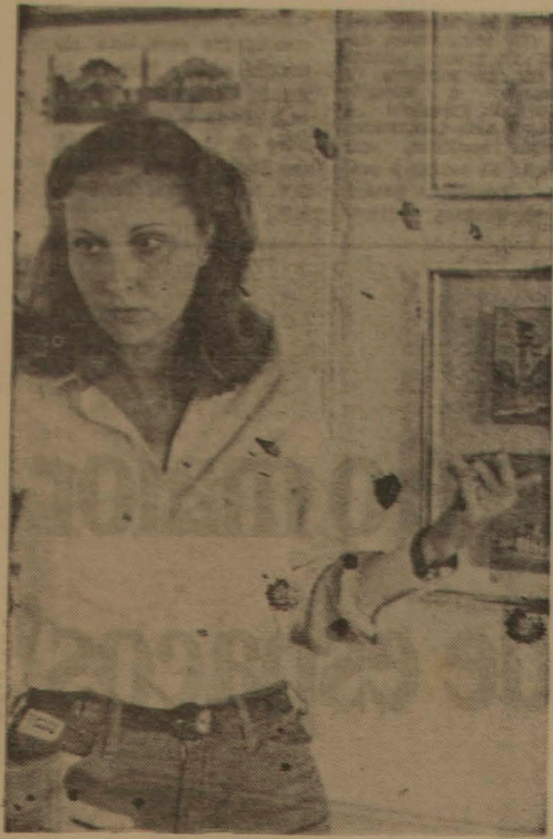
Dulce Soares fotografou a velha arquitetura da Barra Funda.