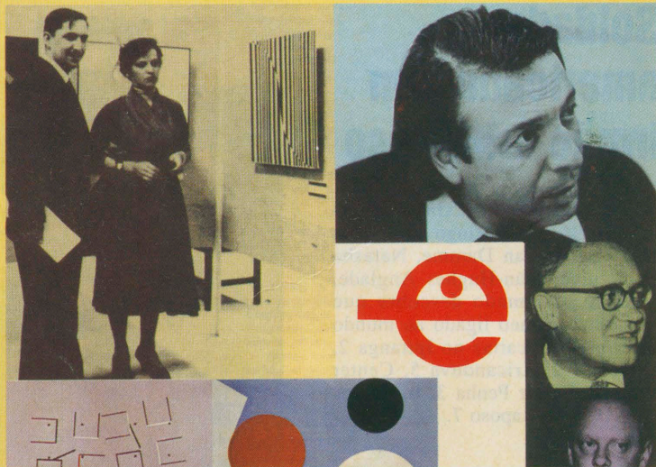
Exposição faz homenagem à primeira mostra de arte concreta

Casa das Rosas - Avenida Paulista, 37, Paraíso. Tel: 251-5271. Contrastando com as modernas construções da avenida Paulista, a mansão do tempo dos Barões do Café, apesar de restaurada para abrigar obras do Governo do Estado, mantém a arquitetura original da época em que foi erguida. O museu leva esse nome por causa do imenso jardim de roseiras que tem na frente. Até o dia 2 de fevereiro os visitantes poderão apreciar a Desexp(1)os(ignição), uma homenagem aos 40 anos da primeira Exposição Nacional de Arte Concreta, que aconteceu no Museu de Arte Moderna de São Paulo em dezembro de 1956 e no Rio, em fevereiro de 1957. O nome da mostra foi dado por Haroldo de Campos. Pode ser visitada de terça a domingo, das 12h às 20h. Grátis.