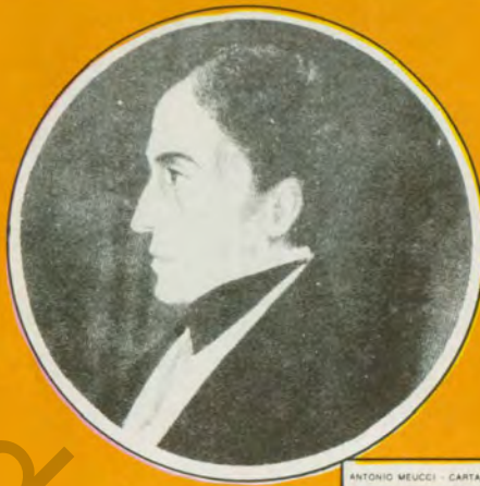
ANTONIO MEUCCI - CARTAGENA - 1830