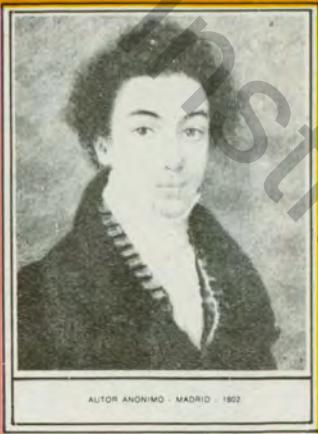
AUTOR ANÓNIMO - MADRID - 1802