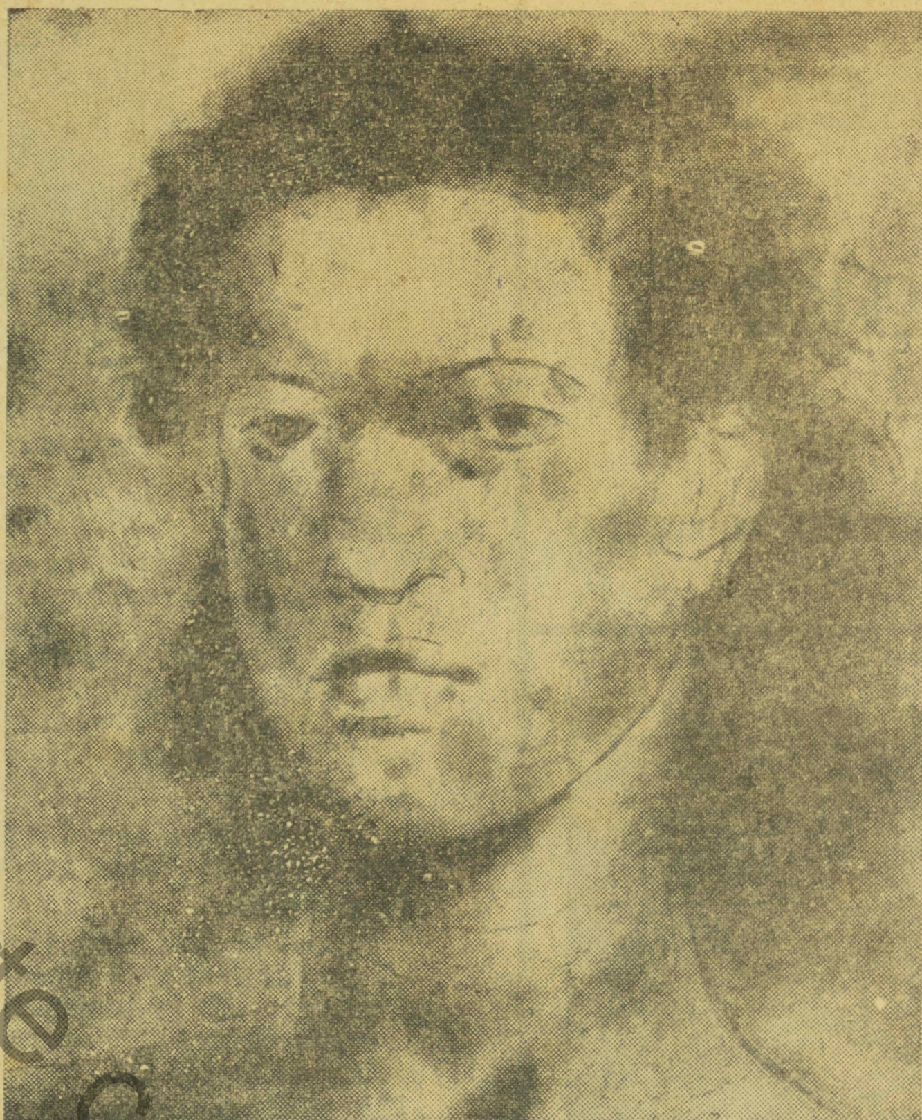
Portinari em leilão