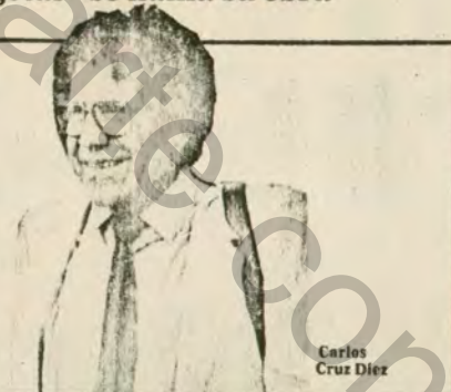
Carlos Cruz Díez

"Cada generación tiene que inventar su expresión; su arte".