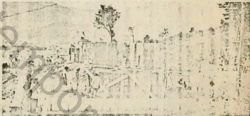
En el Cerro

los paseantes. El principio es la acción efímera, la obra que desaparece con el pasar de los paseantes.