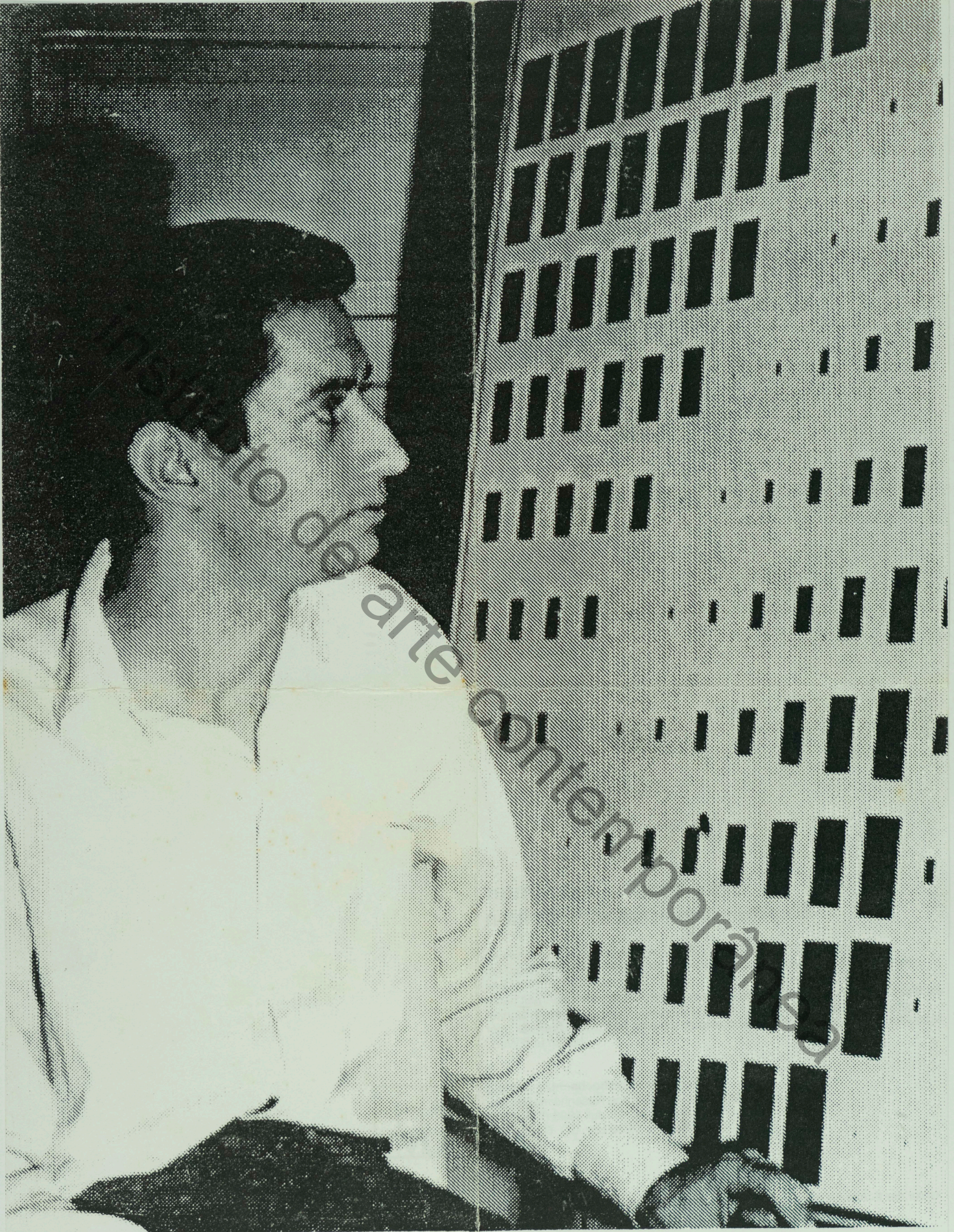
Ivan Serpa - Konkreter Expressionismus in Brasilien