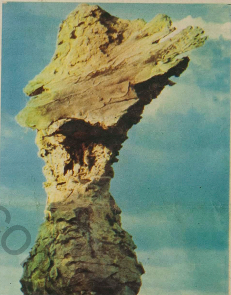
Segundo Zanini, as esculturas naturais na fotos acima se devem a formações geológicas transformadas por chuvas, erosão, ação das águas e outros fenômenos.