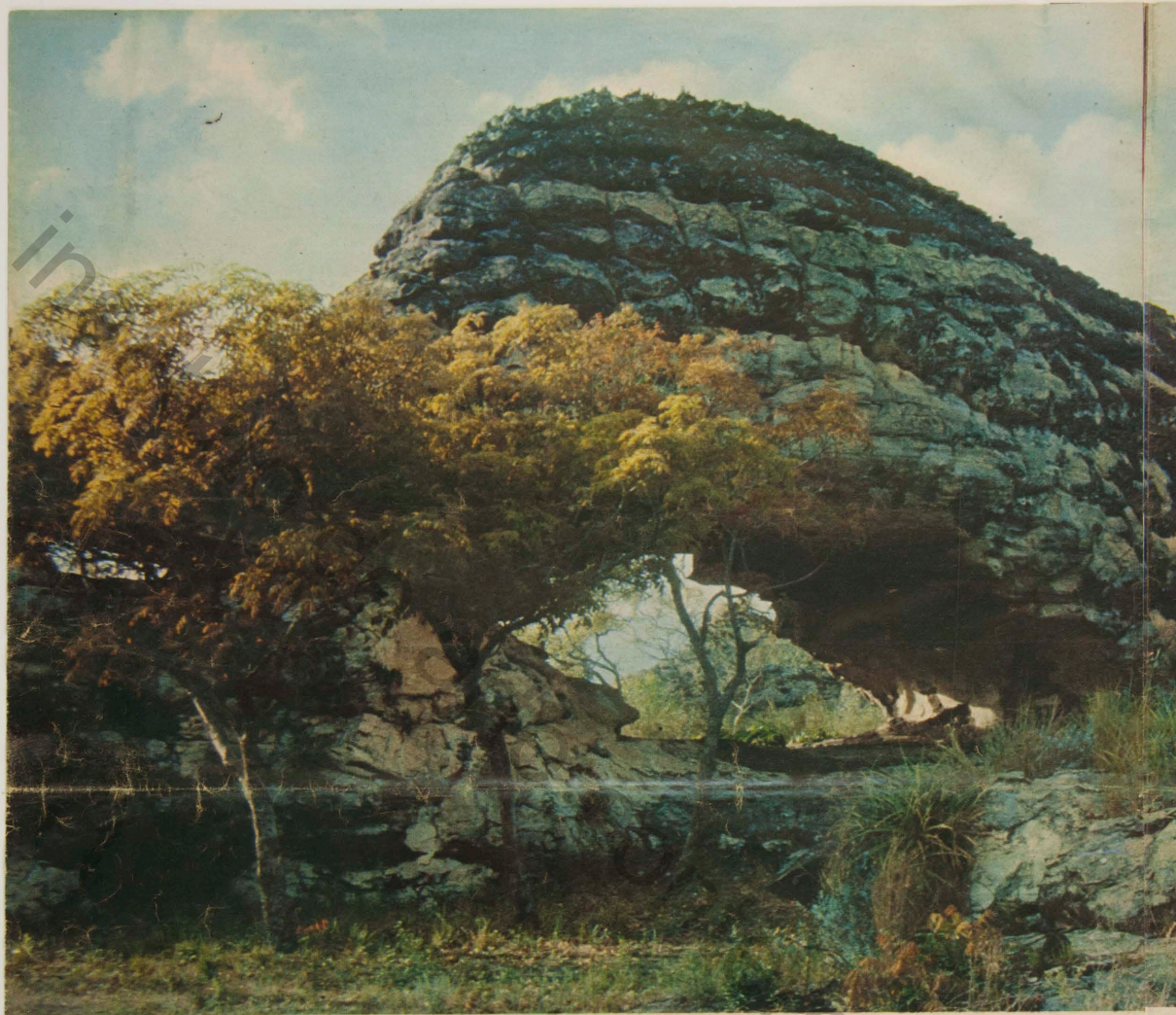
Uma curiosidade para encantar os turistas: essa formação geológica é apenas um acidente natural ou, como dizem as lendas, a b