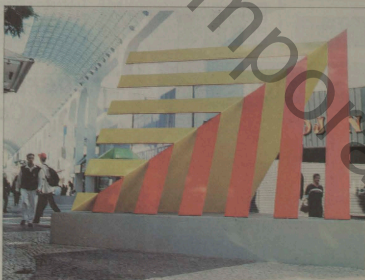
'Concreção 0005', escultura em aço carbono pintado, com 4 metros de altura, construída em 2000 e instalada em Santo André, cidade onde nasceu e viveu