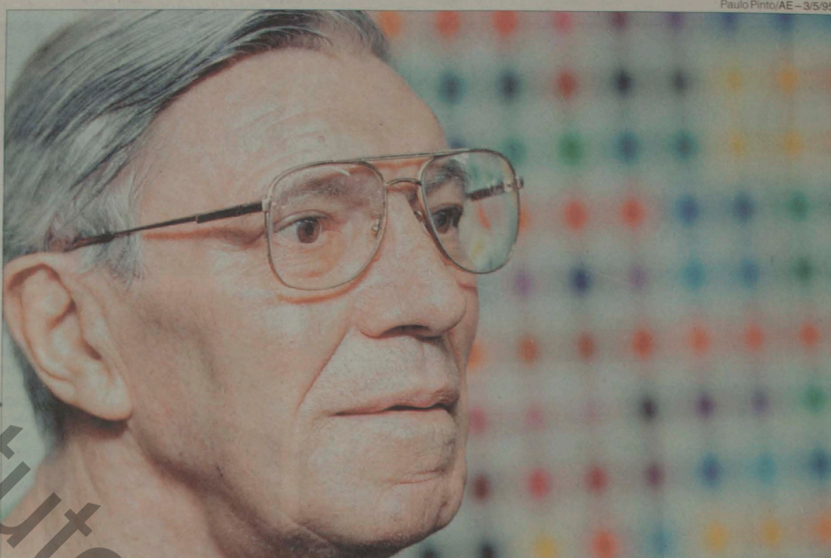
Luiz Sacilotto: artista manteve-se interessado ao longo de sua carreira pela lógica das formas, traduzindo em signos o mundo à sua volta

Mas por razões econômicas foi necessário ainda algum tempo para que ele se afirmasse como artista. Formado em 1944, Sacilotto começou a trabalhar como desenhista de letras de alta precisão e depois como auxiliar num escritório de arquitetura, enquanto se dedicava à pintura e ao desenho, com forte teor expres-