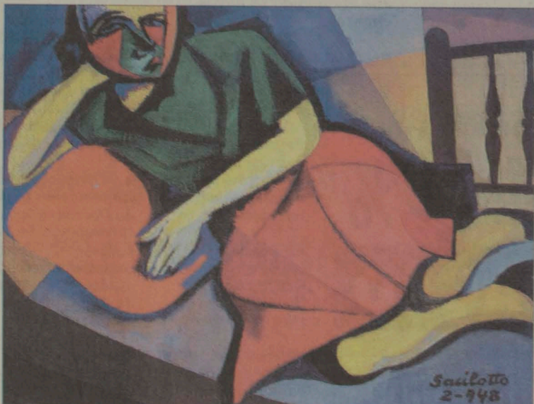
'Figura', óleo sobre tela: nos anos de 48 e 49 artista vai aos poucos mudando a cena em uma composição geométrica, dissecando-a em planos e cores

Se sua cidade natal o lembrou recentemente, há bastante tempo que não se realiza uma grande mostra de sua obra. Galerias como Silvano Nery e Dan também realizaram exposições com recortes de sua produção, mas sua última retrospectiva data de 1985.