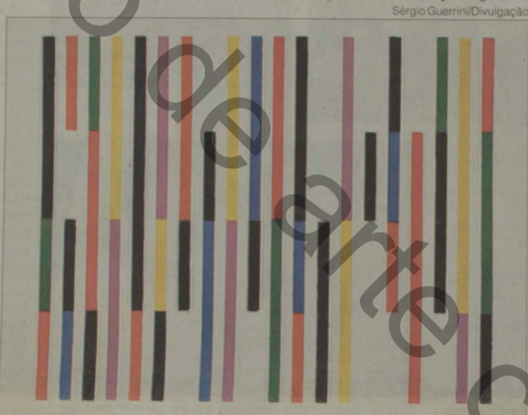
'Concreção', obra de 1952: um de seus estudos geométricos da superfície