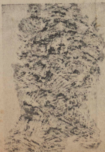
F. KRAJCBERG. COMPOSITION.

Reste la section brésilienne contemporaine qui permettra au Salon Comparaisons de figurer dans les manifestations du IV e centenaire de Sao Paulo par le jeu savant des échanges. La sélection a été faite selon un dosage plus diplomatique qu'esthétique. Un peintre de chaque tendance, cela ne représente pas l'actualité de la peinture brésilienne et cela ne fait pas non plus un accrochage agréable à regarder. C'est un échantillonnage sans amour ni connaissance