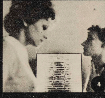
EL MUSEO DE ARTE DE LÓDZ COLECCIONA OBRAS DE LA VANGUARDIA ARTISTICA DE TODO EL MUNDO. EN LA FOTO, UN CUADRO DE LA ARGENTINA MARTHA BOTO. PÁGS. 26-29