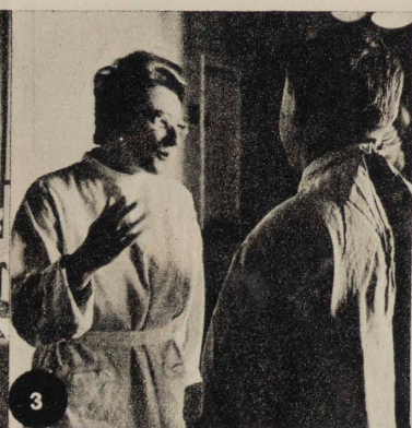
EN LAS PÁGS. 6-7, ARTICULOS DE UNA INGLESA Y DOS POLACOS SOBRE LA ESCUELA DE ENFERMERAS DE LA ACADEMIA DE MEDICINA DE LUBLIN