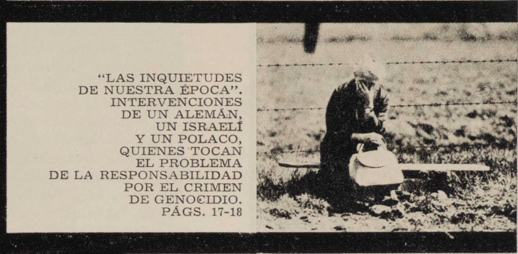
"LAS INQUIETUDES DE NUESTRA ÉPOCA". INTERVENCIONES DE UN ALEMÁN, UN ISRAELÍ Y UN POLACO, QUIENES TOCAN EL PROBLEMA DE LA RESPONSABILIDAD POR EL CRIMEN DE GENOCIDIO. PÁGS. 17-18