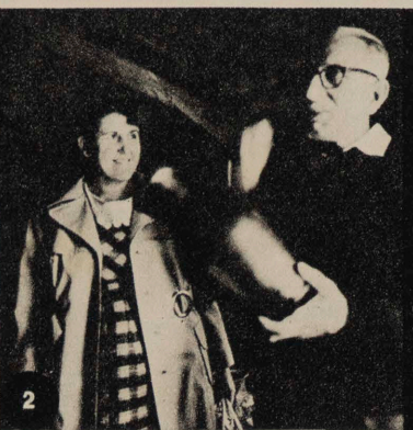
LAS LLAVES DE LA CIUDAD EN MANOS DE UNA MUJER. EJEMPLAR ADMINISTRACIÓN. REPORTAJE ILUSTRADO. PÁGS. 10-12