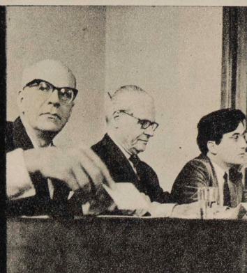
LA COMUNA DE PARÍS, VISTA POR FRANCESES Y POLACOS. PÁGS. 24-25