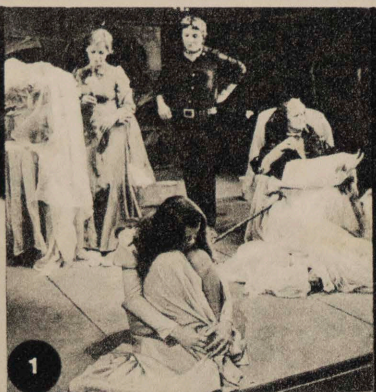
MANIFIESTA CONTRADICCIÓN ENTRE LA FUNCIÓN DE MANAGER DEL ARTE Y LA LABOR ESTRICTAMENTE CREADORA DEL DIRECTOR DE ESCENA. PÁGS. 36-39