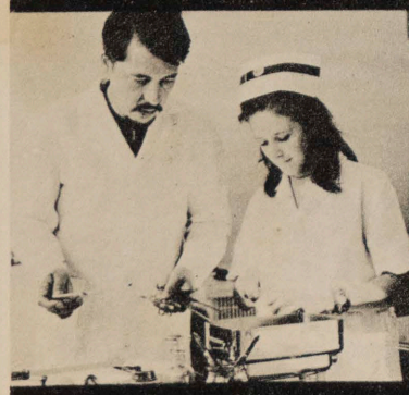
LA LABOR DEL MEDICO DE ALDEA NO SE REDUCE A LA CUBACION DE ENFERMOS. PÁGS. 42-43