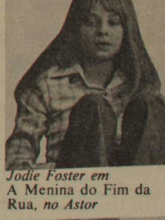
Jodie Foster em A Menina do Fim da Rua , no Astor