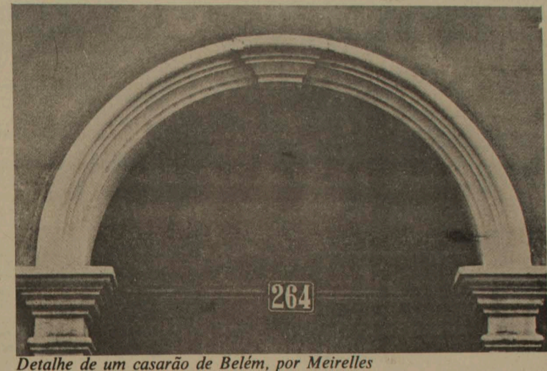
Detalhe de um casarão de Belém