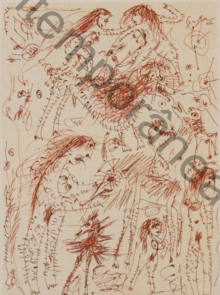
IVAN SERPA MULHERES E BICHOS, 1962 ESFEROGRÁFICA S/PAPEL 25x18,5 CM