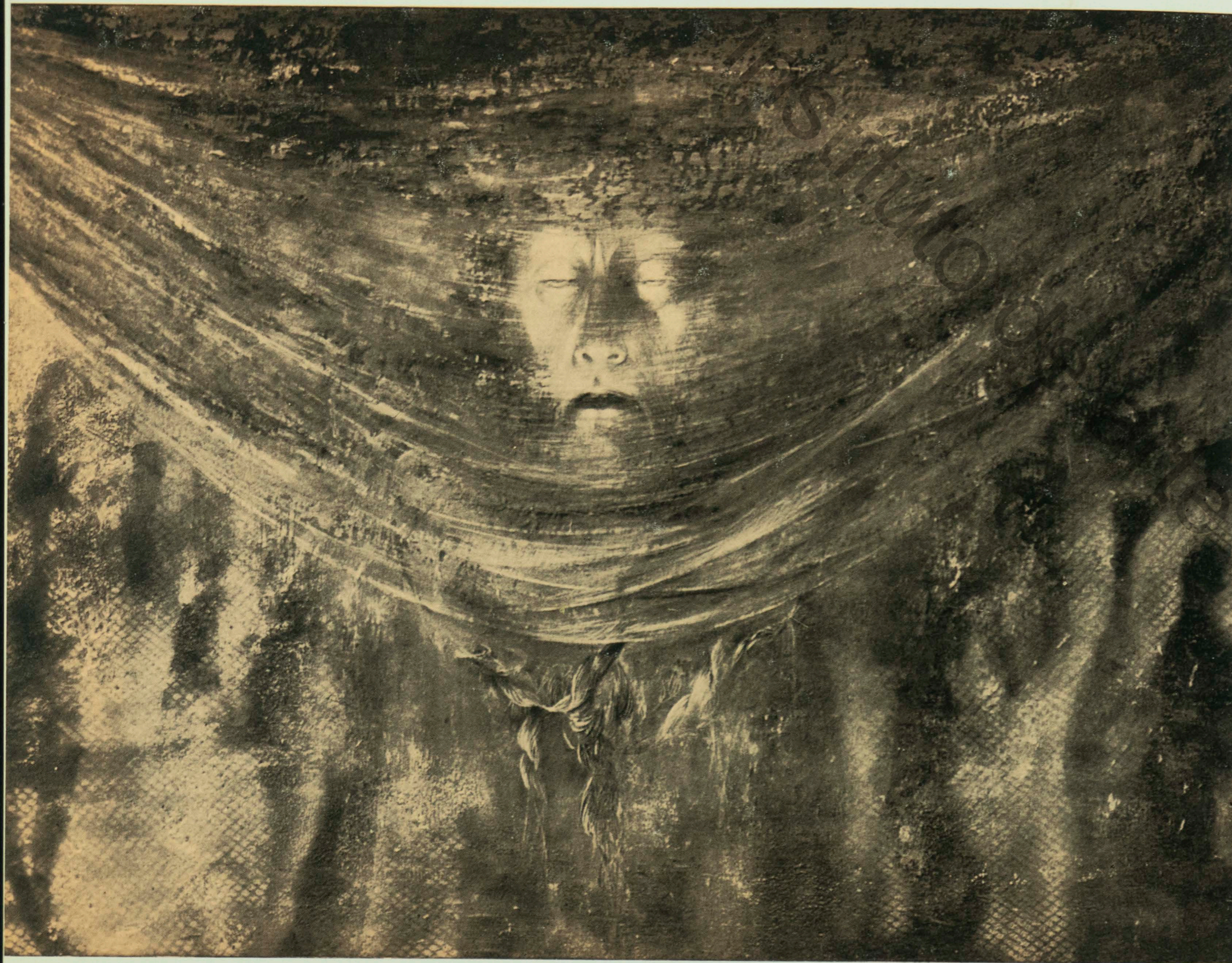
La voile de Veronique