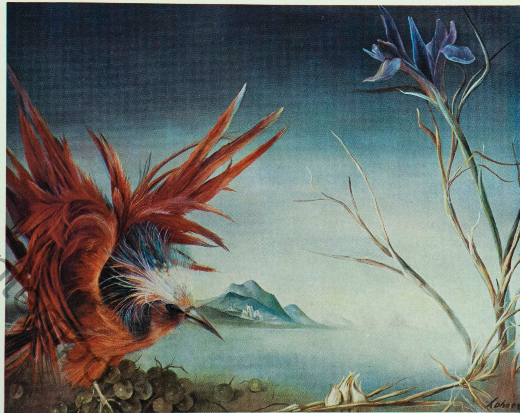
L'oiseau de feu