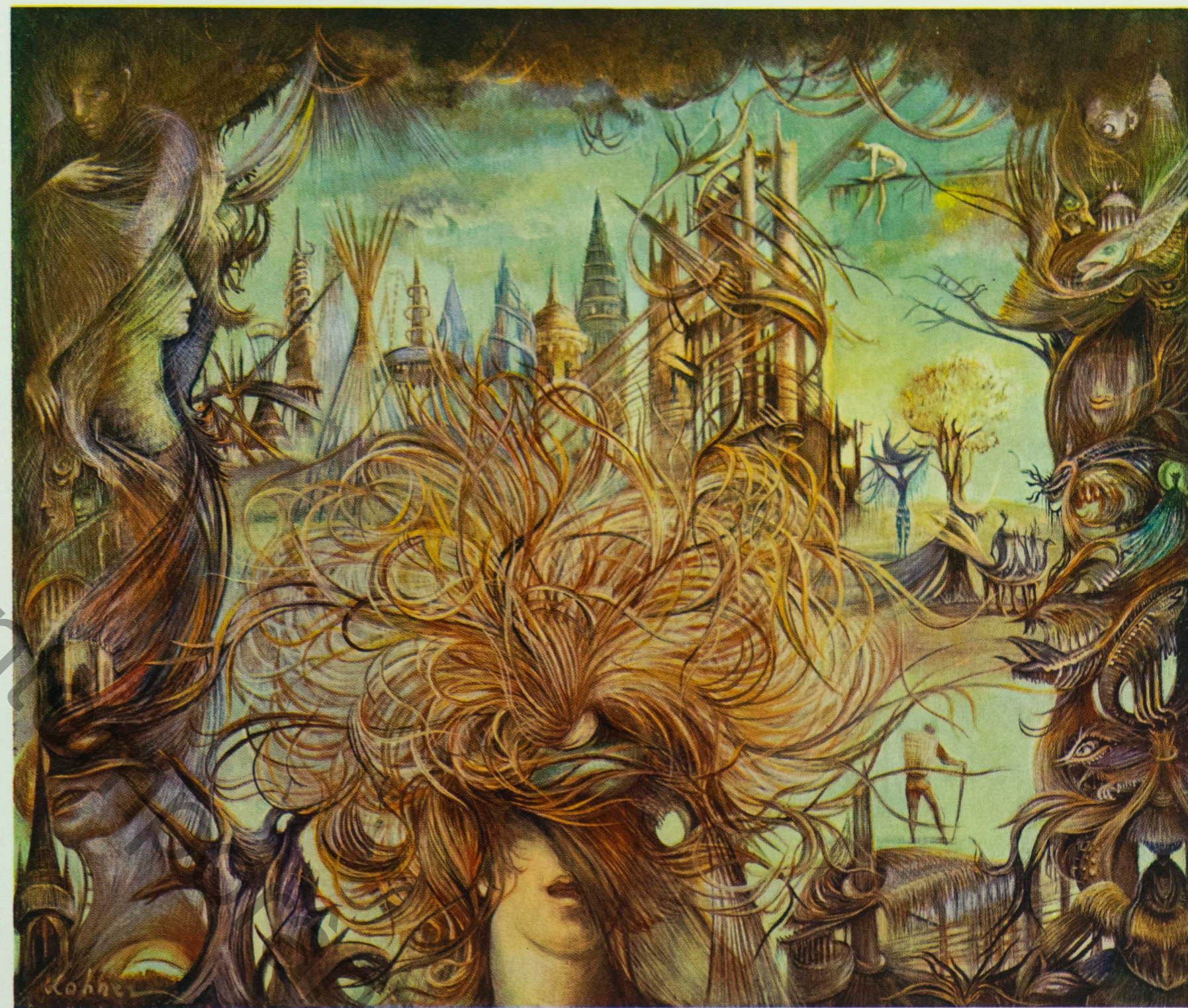
Dans des Ravins