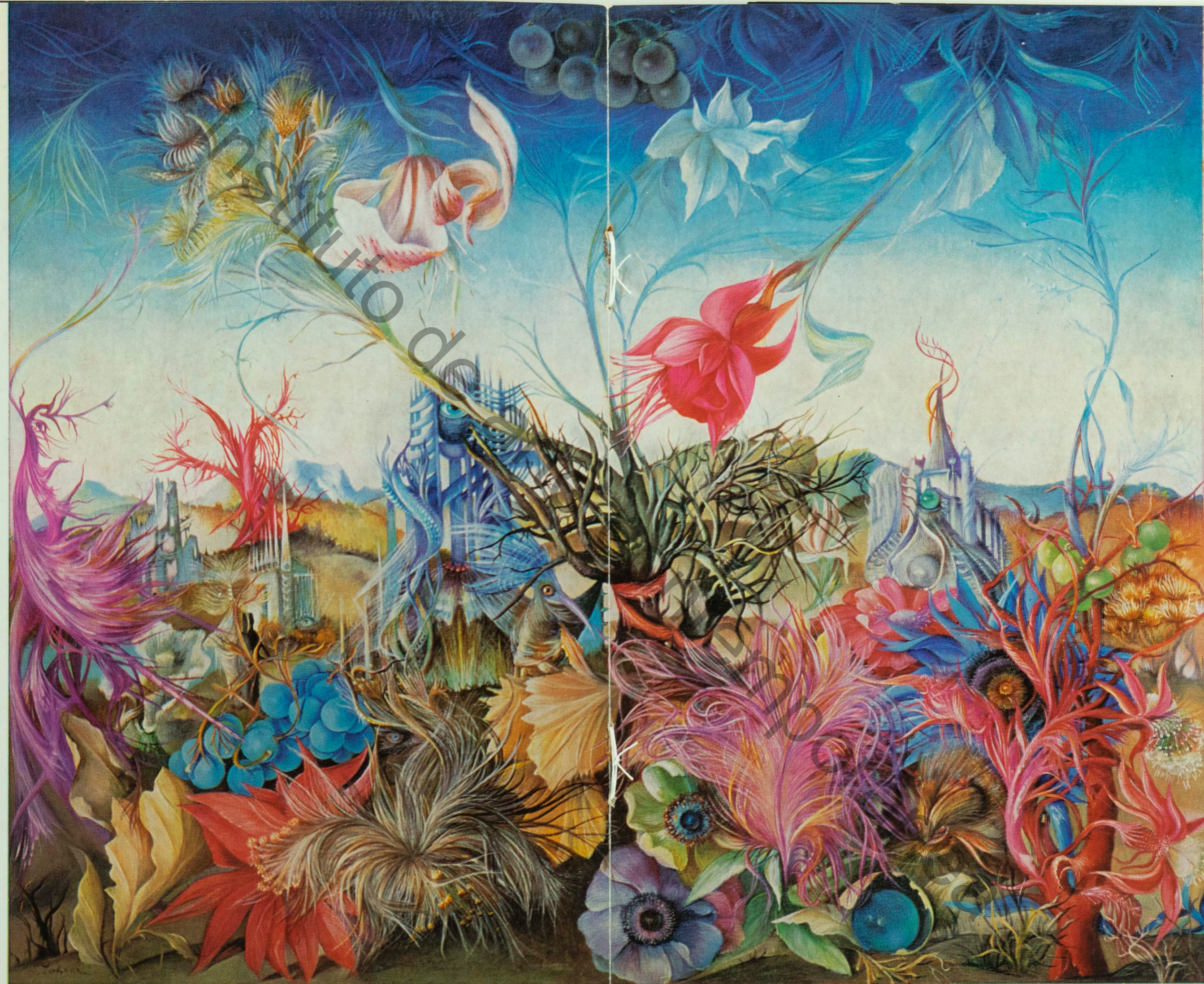
Dans la Jungle des fleurs perdues