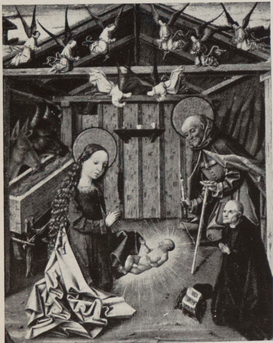
Portada: MAESTRO DE ÁVILA: «Nacimiento de Cristo». Tabla central del tríptico del Nacimiento. Museo Lázaro Galdiano. Madrid.

FOTOGRAFÍAS COLOR: LOYGORRI (portada y encarte 1.º), ORONoz (encarte 3.º), Madrid. POTOGRABADOS COLOR: TARDIU, Barcelona (portada y encartes 1.º y 3.º); VERLAG NEUES ABENDLAND, Munich (encarte 2.º), FOTOGRAFÍAS NEGRO: BALMES, Madrid; ARCHIVO MAS, GALERÍAS SYRA, F. SERRA, Barcelona; F. GARAY, Valladolid.