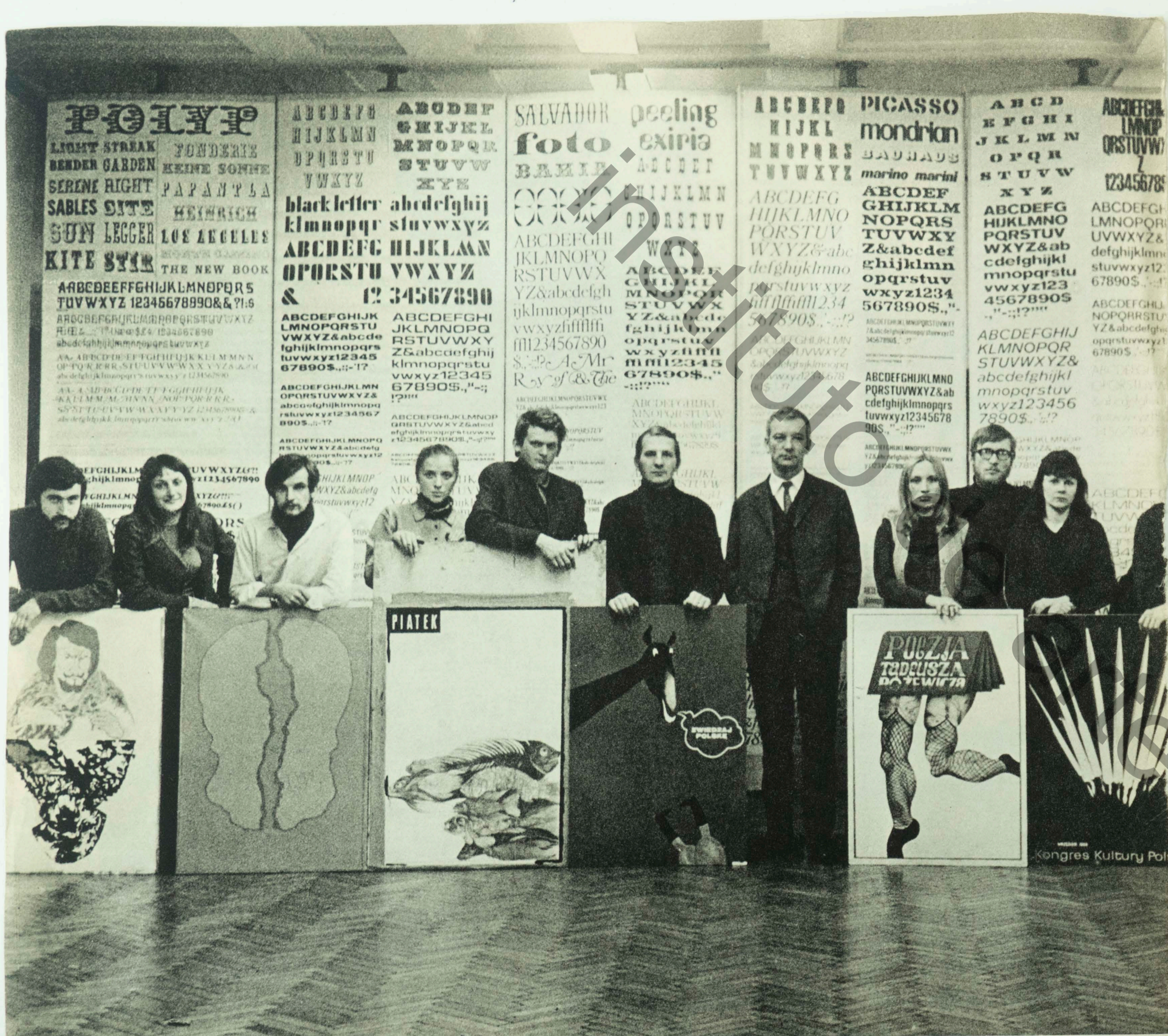
JÓVENES, LOS PROFESORES Y LOS ALUMNOS. CLASE DE CARTEL EN KATOWICE