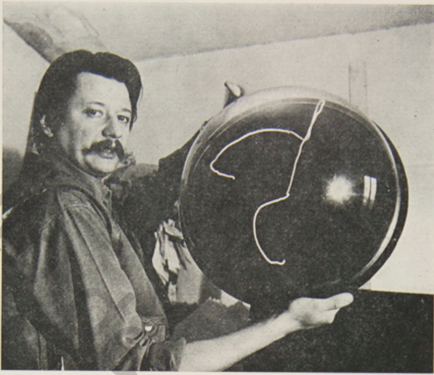
Excitable, 7103, 1971, diam. : 40 cm.