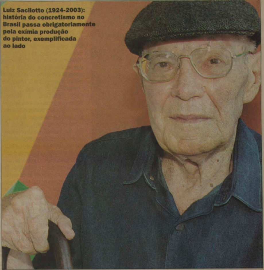
Luiz Sacilotto (1924-2003): história do concretismo no Brasil passa obrigatoriamente pela exímia produção do pintor, exemplificada ao lado