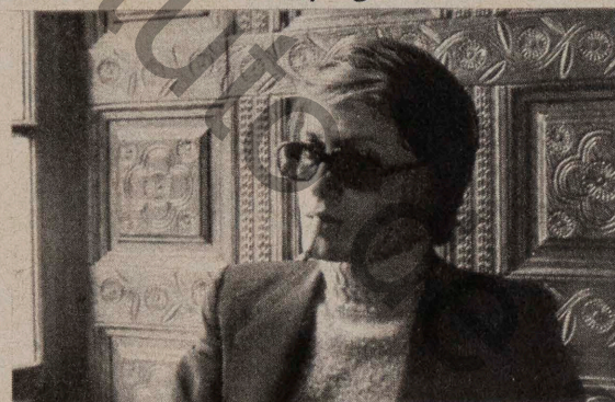
DUTRONC (page 83)