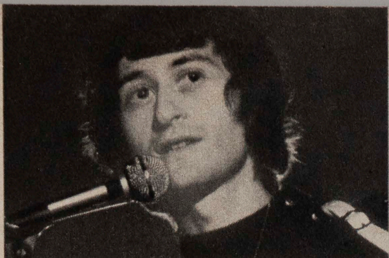
MICHEL POLNAREFF (page 32)