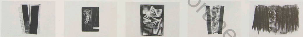
Suite des 5 lithographies (numérotés I à LXXV)