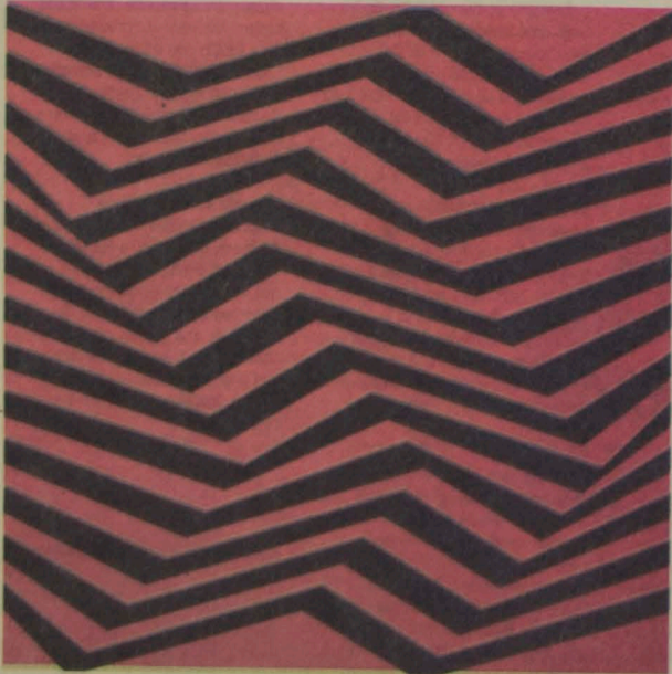
C9984, tela em têmpera acrílica com dimensões de 110 cm por 110 cm