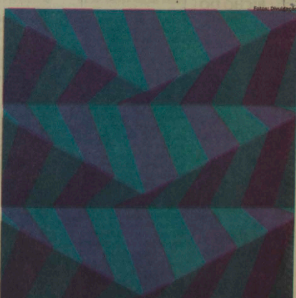
Gravura 37, uma das obras que estarão em exposição na Sabina