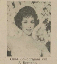
Gina Lollobrigida em A Romana