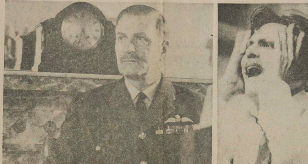
Laurence Olivier em A Batalha da Grã-Bretanha (Canal 13, 21h10m)