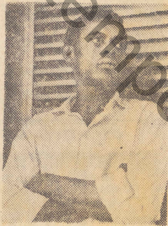
A Pintura está nêle desde a infância. Não se lembra de quando começou a gostar das tintas, já nasceu gostando

Gosta da pintura a bico-de-pena. Vários de seus desenhos têm sido vendidos.