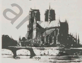
Kohlhammer Kunst- und Reiseführer

Paris Von Josef Maximilian Wiesel Ein Kunst- und Reiseführer 2., völlig neu bearbeitete Auflage. 364 Seiten mit Plänen. Balacron DM 29,80. ISBN 3-17-001195-2