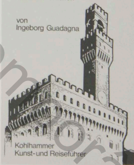
Kohlhammer Kunst- und Reiseführer