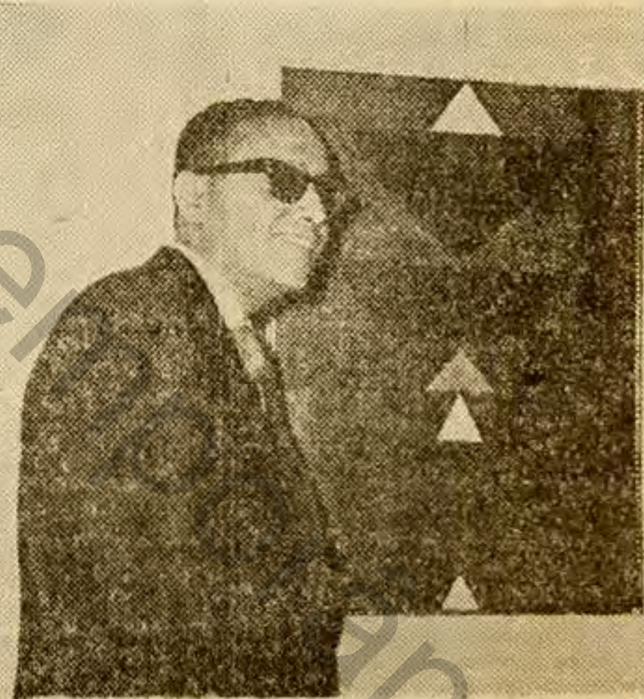
O pintor Rubem Valentim ao lado de sua tela ("Composição n.º 20"), também classificada em primeiro lugar