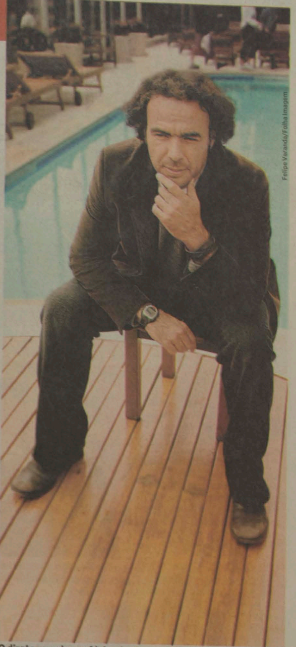
O diretor mexicano Alejandro González Iñárritu, no Rio