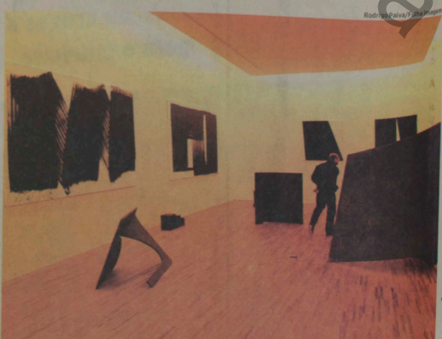
IAC abriga trabalhos de Mira Schendel, Amílcar de Castro, Sergio Camargo e Willys de Castro

BUENBA! BUENBA! mão Urgente! Cor-geral da Re to do Pleito Caido!