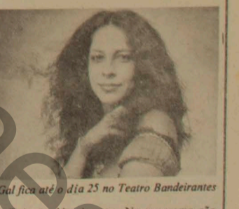
Gal fica até o dia 25 no Teatro Bandeirantes

MESTRE CARTOLA ( Teatro Celia Helena ) - Barão de Iguape, 113 - São Paulo) - Espetáculo de samba com Cartola