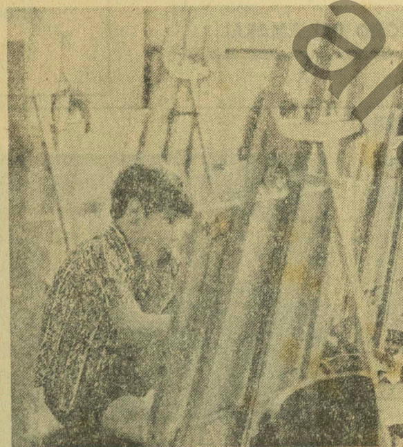
Apesar de tudo parecer uma brincadeira, as crianças desenvolvem no Atelier Infantil de Ivã Serpa, sua criatividade e sensibilidade artísticas

sando comigo, ela acaba acertando. Faço questão que os alunos descubram o mundo encantado da cor e da própria forma, sozinhos, sem interferência minha.