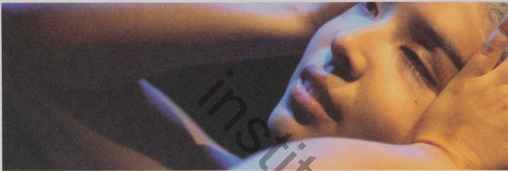
"e eu disse:", com letícia sekito