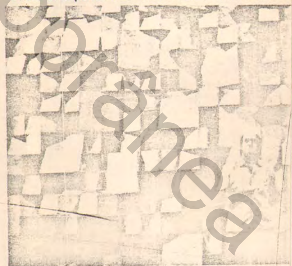
"Detalle de la pared ornamental del Palacio Itamaraty," en B