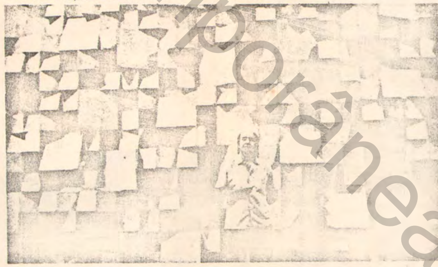
"Detalle de la pared ornamental del Palacio Itamaraty," en Brasilia.

"El artista organiza su lenguaje para decir lo que quiere o puede decir. No encuentro dificultades en hablar con los elementos de mi lenguaje —puedo decir todo lo que quiero—. Es como si fuera un simbiosis entre mí y esos elementos, y entre la obra y yo" "... Mi problema directo es de investigación y de trabajo con elementos plásticos. Es una área de trabajo muy específica —el campo plástico— porque él crea realidades plásticas, las cuales —como son hechas por el hombre— son realidades humanas. Yo soy el que las hago, los otros las observan. Esta realización está ubicada en un nivel plástico. Pero yo encuentro que en el proceso creador hay un otro nivel; vamos a decir que sea un nivel psicoanalítico. Pienso que todo el artista hace una transferencia emocional al objeto, y que el objeto sea capaz de pasar esta