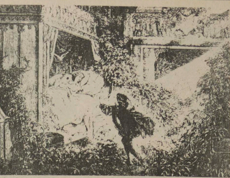
A Bela Adormecida, de Dorc.

Sempre foi assim? Não, houve um tempo em que o homem e a mulher costumavam dormir numa cama de penas, em vez de uma cama de espumas. Dormiam nus, inocentes, cansados de um trabalho honesto e acordavam de manhã com o sol na face.