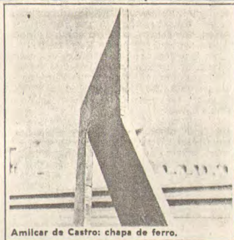
Amílcar de Castro: chapa de ferro.