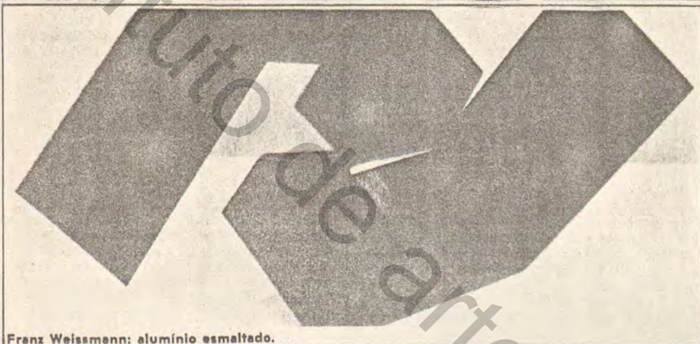
Franz Weissmann: alumínio esmaltado.