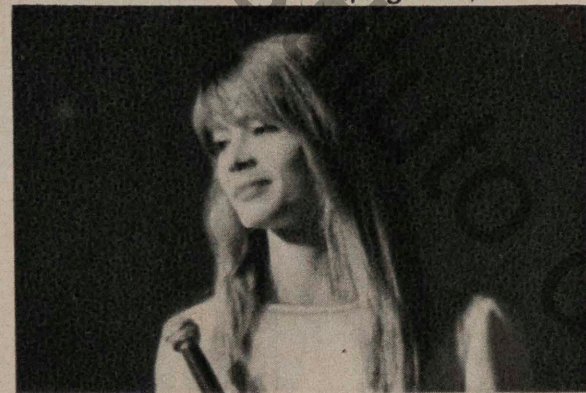
FRANÇOISE HARDY (page 96).