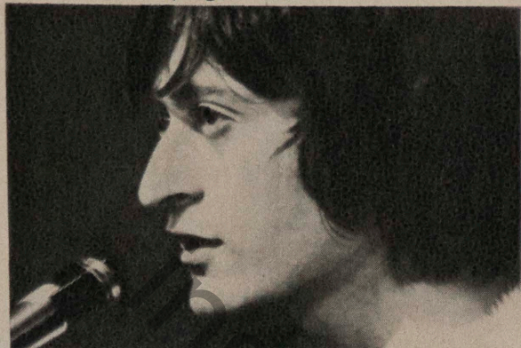
MICHEL POLNAREFF (page 92).