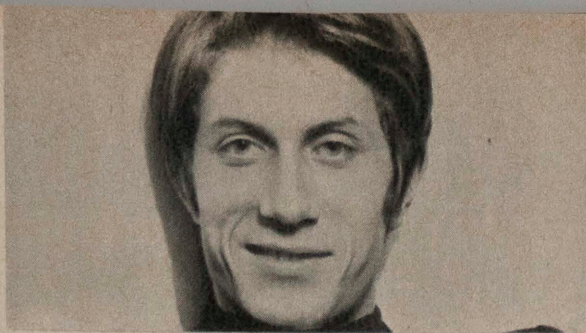
DUTRONC (page 42).