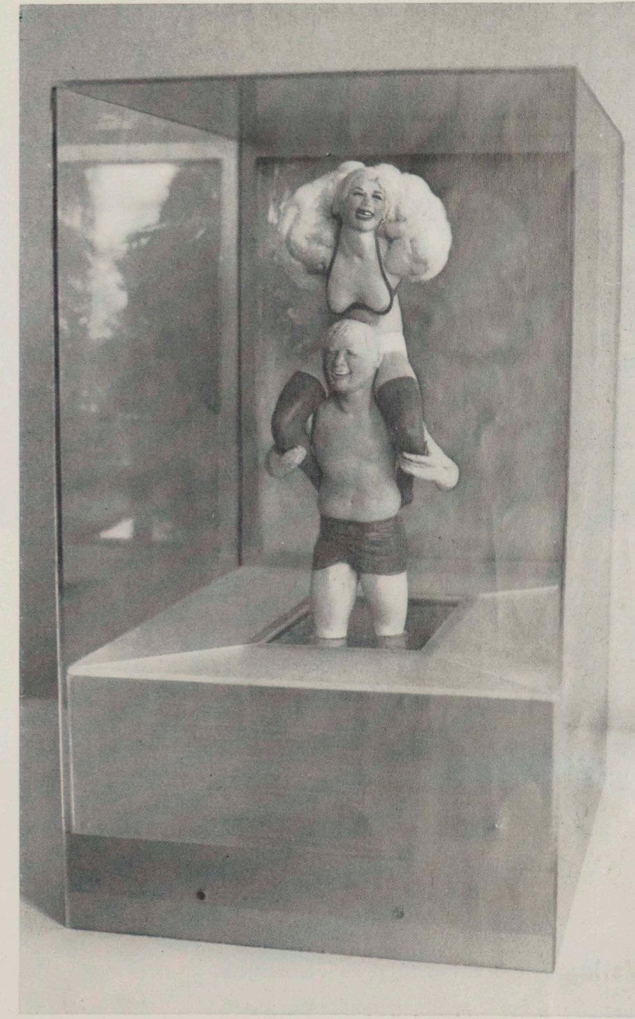
Robert Graham: Untitled 1967