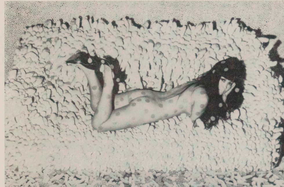
Yayoi Kusama on Phallic Sofa 1962