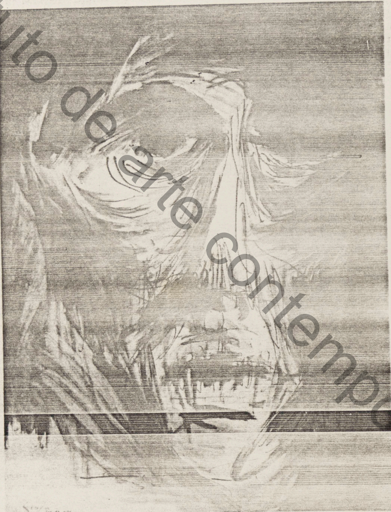
Trinta telas de Ivan estão na Triáde Galeria de Arte

Uma oportunidade rara para os admiradores da pintura de alto nível é o que a Triáde Galeria de Arte oferece a partir de hoje. Nada menos que uma retrospectiva de Ivan Serpa, reunindo mais de 30 telas das diversas fases do artista, numa mostra que terá direito a palestras e debates sobre sua obra, conduzidas por amigos e ex-alunos, pessoas que conviveram intimamente com ele.