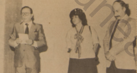
Grabados de Cartón Colombia