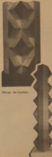
Obras de Castles.