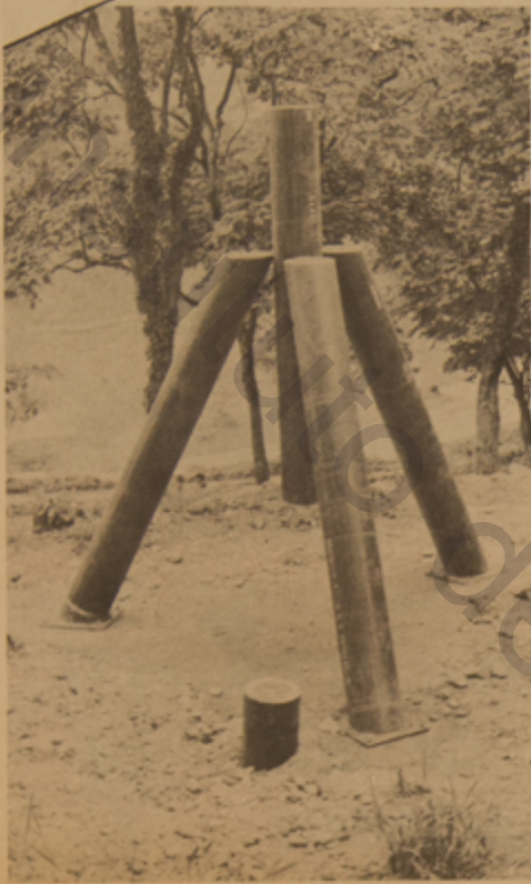
Obras de John Castles en el Cerro Nutibara