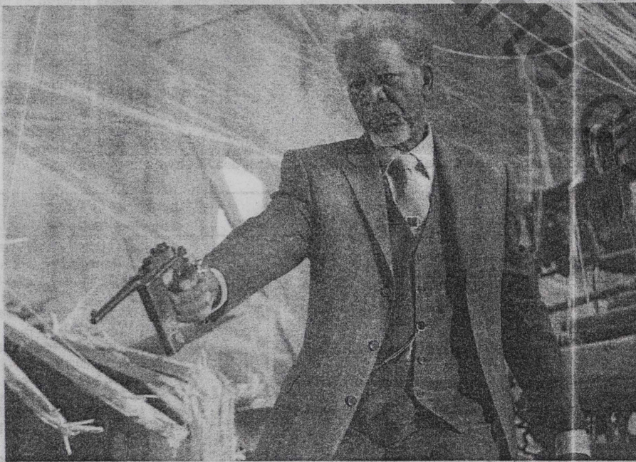
Morgan Freeman no filme ainda inédito 'O Procurado', com estréia prevista para dia 22

Além de sua vitória por "Menina de Ouro", Morgan Freeman, que tem mais de 35 anos de carreira, foi indicado ao Oscar por outros três filmes: "Armação Perigosa", "Conduzindo Miss Daisy" e "Um Sonho de Liberdade". Recentemente também pôde ser visto na comédia dramática "Antes de Partir", em que contracenou com Jack Nicholson como um doente de câncer que resolve aproveitar seus últimos dias viajando pelo mundo ao lado de um milionário.