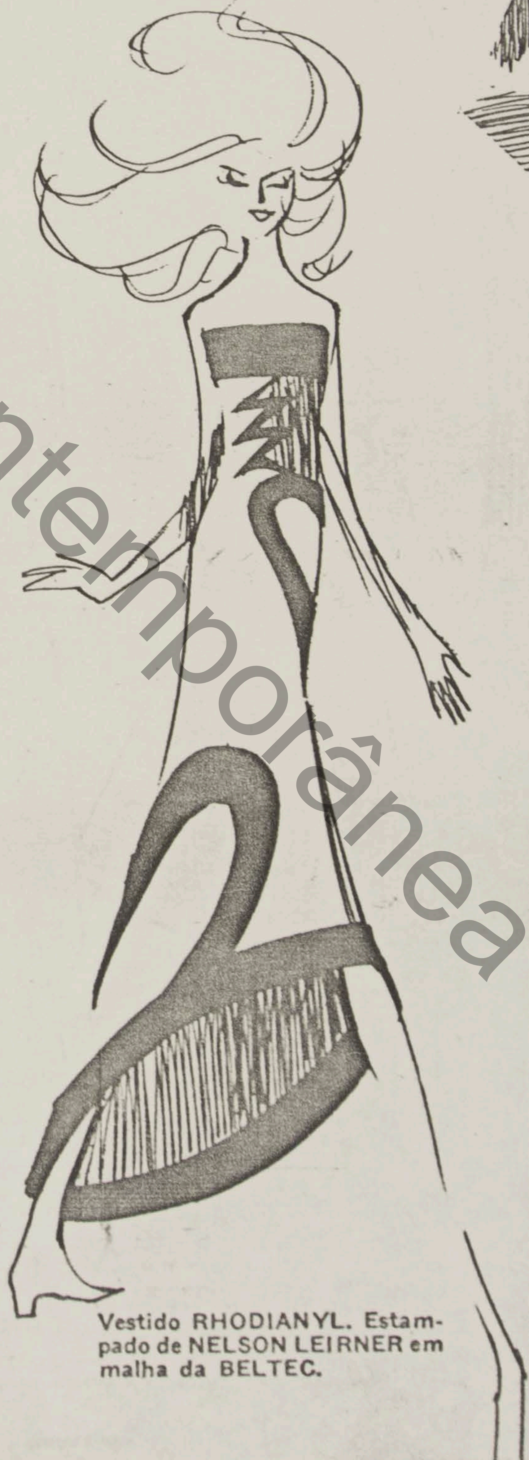
Vestido RHODIANYL. Estampado de NELSON LEIRNER em malha da BELTEC.