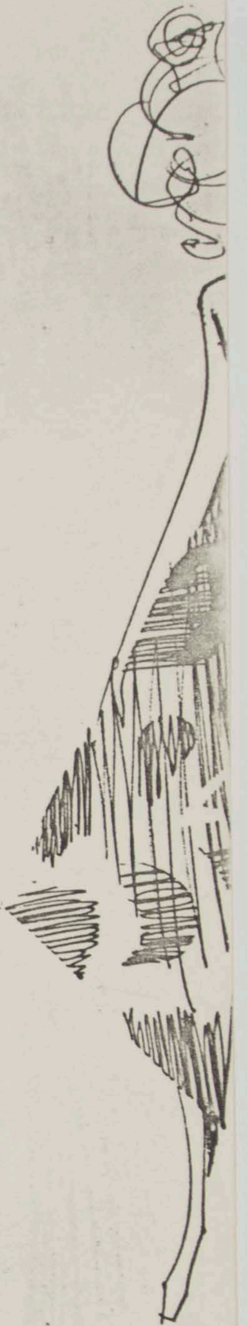
Palazzo toile da Desenho MEIDA TURARI CRUZEI