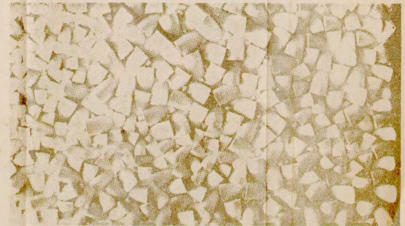
SERGIO DE CAMARGO "ESCULTURA"

Gran Premio de la Tercera Bienal de Jóvenes de París. 1963.