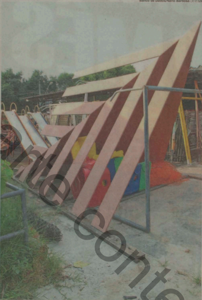
Banco de Dados/Nario Barbosa (7/7/15)

ARTE ANDREENSE. As voltas que o mundo Sacilotto precisa dar e a cidade não consegue entender o seu talento, o seu esforço, o seu amor ao torrão natal