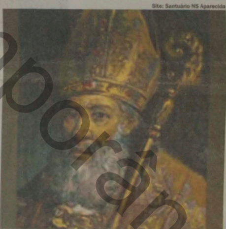
São: Santuário NS Aparecida