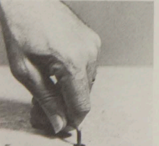
Serrer 9 tours suffisent