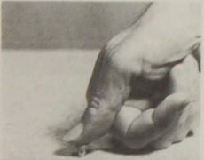
« A fond »